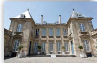
Musée des Arts Décoratifs

Rendez-vous: 15h40 à FRENCH FACTORY Bordeaux Exposition Henri IV