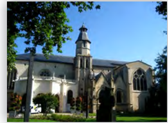
Basilique Saint Seurin

Rendez-vous: 15h à FRENCH FACTORY Bordeaux